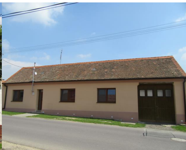
Číslo popisné 25