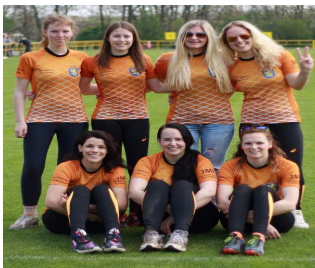
Základní sestava SDH Vítovice ženy pro sezónu 2017