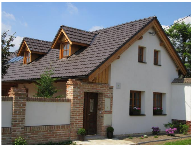
Číslo popisné 52