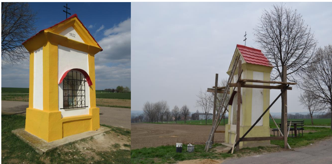
Kaplička na návrší