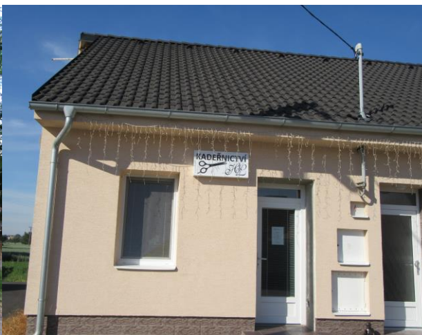
Číslo popisné 49